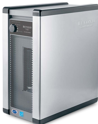
BEYOND GUARDIAN AIR COPERTURA FINO A 200MQ